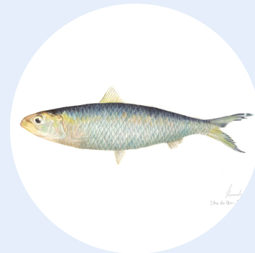
Fotografia: Irmãos Mello (2022)