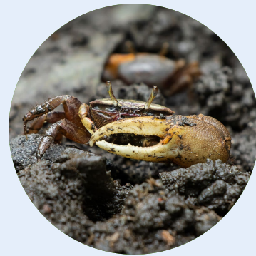
Fotografia: Irmãos Mello (2022)