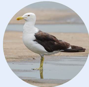
Fotografia: Irmãos Mello (2022)