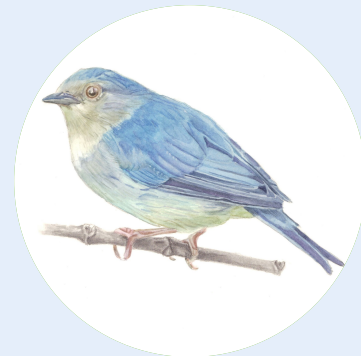
Fotografia: Irmãos Mello (2022)