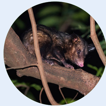
Fotografia: Irmãos Mello (2022)