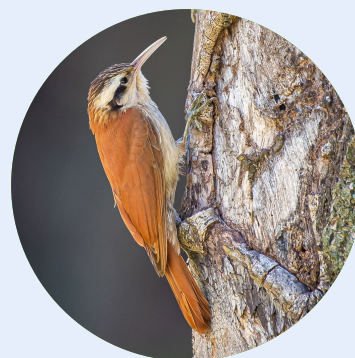
Fotografia: Irmãos Mello (2022)