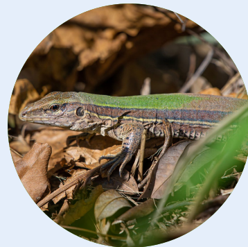
Fotografia: Irmãos Mello (2022)